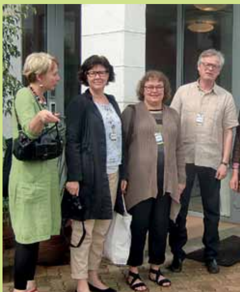
De svenska adoptionsorganisationerna på besök i Kenya. Läs om resan på sid 10