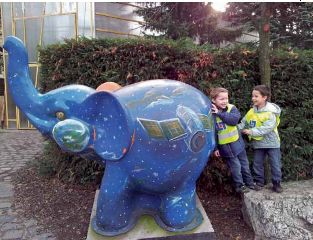
På Zoo i Budapest

– Efter en natt i Tapolca körde vi till Budapest. Där bodde vi i en lägenhet vid